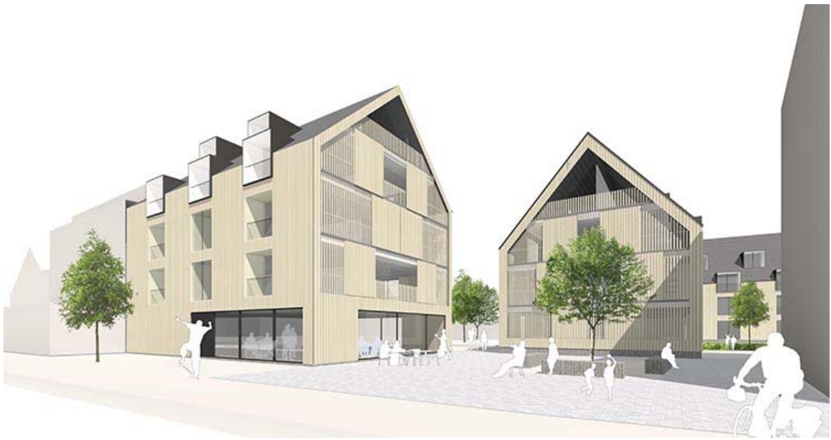
Ortsmitte Schmiden Visualisierung

Unser Entwurf, der unter dem Arbeitstitel „Scheunenviertel“ entwickelt wurde, thematisiert identitätsstiftend vier einfache scheunenartige Baukörper. So nehmen wir mit Maßstab und Körnung Bezug auf den dörflichen Charakter.