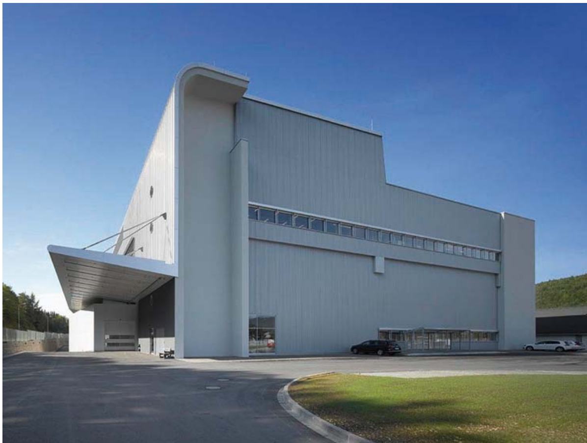
Aesculap Innovation Factory in Tuttlingen

Die Universität Stuttgart, Lehrstuhl für Bauökonomie, hat das Weiterbildungsprogramm des irem (industrial real estate management) ins Leben gerufen.