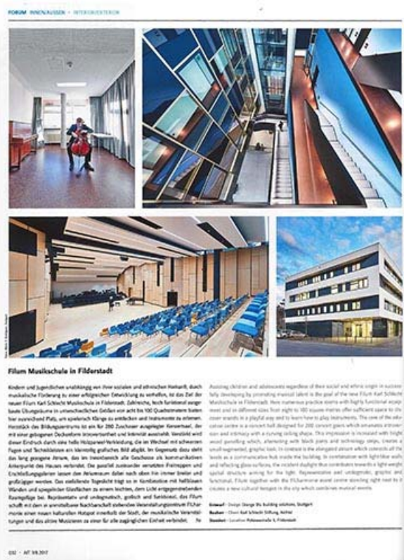
Film Musikschule in der AIT