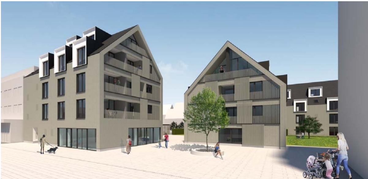
Ortsmitte Schmiden Visualisierung

Unsere Ortsmitte Schmiden mit dem Thema "Scheunenviertel" gedeiht weiter. Bei diesen vier Wohnhäusern in Holzhybridbauweise entwickeln sich spannende Details.