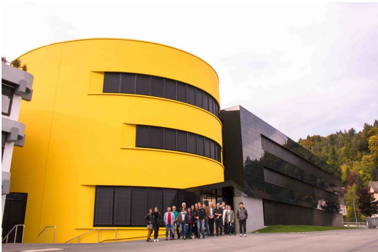
Orange Blu Team vor Sto Gebäude

Bei unserer Exkursion im Dreiländereck haben wir neue Architektur gesehen, Design angeschaut, Kultur erlebt und wunderbares französisches Essen genossen. Einer der Highlights war der Besuch der Sto AG in Stühlingen und des von uns entworfenen Eingangs- und Bürogebäudes.