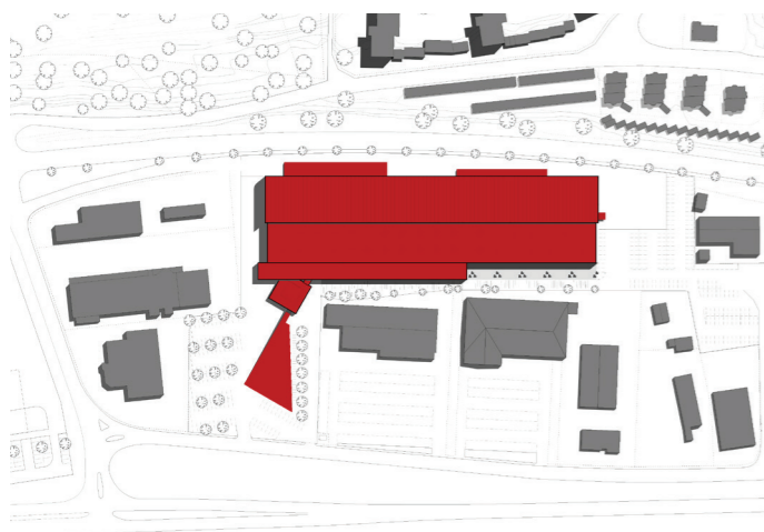
B. Braun Aesculap Innovation Factory, Tuttlingen, Neubau Wettbewerb 1. Preis 2011 Planungsbeginn 2012 Bauzeit 2013-2014 Standort Am Aesculap Platz, 78532 Tuttlingen BGF ca. 24.000 m 2 LPH 1-8 Bauherr B. Braun Melsungen AG Kosten 50 Mio €